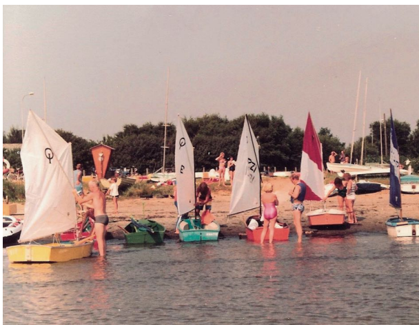
Armada Gubbsegling '81.